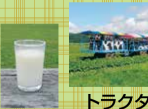
トラクター (拖拉机)