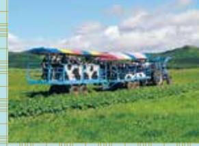
トラクター (拖拉机)