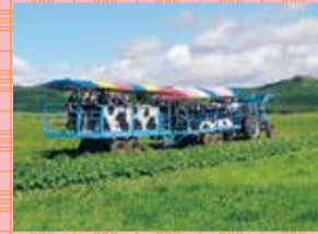
トラクター (拖拉机)