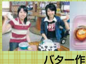
バター作り (黄油制作)