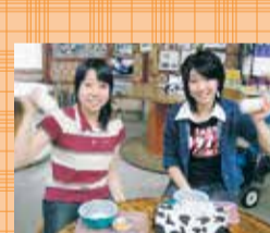
バター作り (黄油制作)